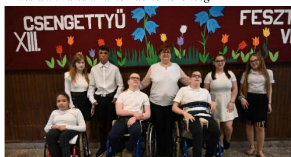
Petőfi Általános Iskola Kórházi Tagozatának csengettyűsei