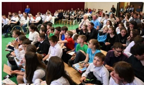
..és akik várták: a hozzáértő közönség