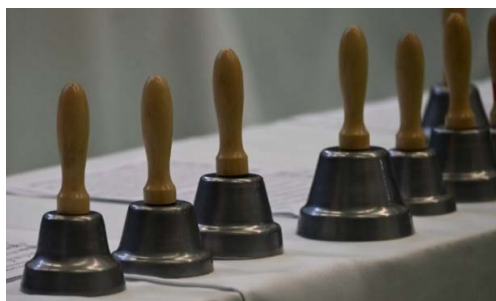
Csengettyűk sorban, megszólalásra várva..