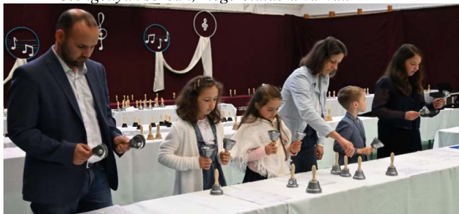
Az Andrassy református lelkész család csengettyű együttese