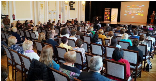
XV. Kárpát-medencei Tehetségnap 2024.03.23.

Idén is Bartók Béla közelgő születésnapjának évfordulójához igazítva, március 23-án zajlott a Kárpát-medencei Tehetségnap , ahol a Felfedezettjeink díjak átadása és a díjazott fiatalok fellépései mellett az idén újra elindított Tehetségpont akkreditáció első körének oklevelei is átadásra kerültek. Felfedezettjeink pályázatra ismételten sok jelentkezés érkezett, 3 pályázó fődíjat, 9 fiatal pedig különdíjat kapott. Az elmúlt 16 évben már közel 250 kimagaslóan tehetséges fiatal részesült ösztöndíjban és kapott elismerést.