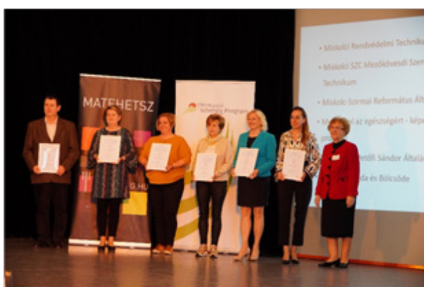
Tehetségpont akkreditációs oklevelek átadása