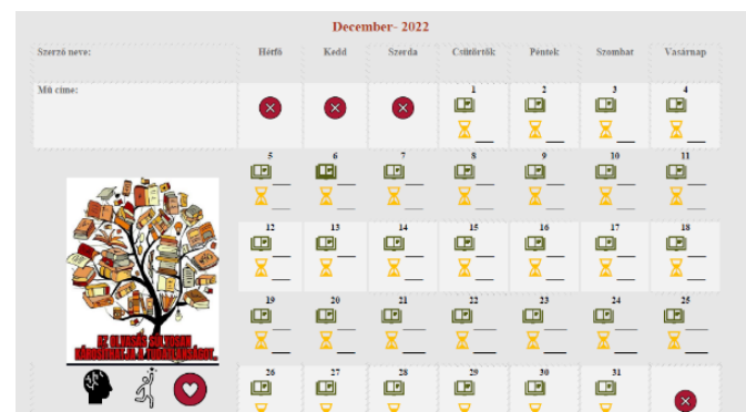
3. ábra: Részlet az Olvasónaplóm munkafüzetből

Az újítás következtében, lemondtam a diákok által készített nagyon egyedi, olykor koncepciótlan naplócskákról. Helyette - már a tavalyi (2021/2022) tanévre - elkészítettem egy kézzel fogható és tölthető, kilenc hónapot felölelő naptárral egybekötött 'füzetnaplót', amelyben kreatív tanulókártyákat helyeztem el, segítve ezzel is a diákok