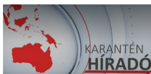
2. ábra: A mozgalom híradójának egy képkockája

Így született meg a Karantén Híradó névre elkeresztelt produktum, mely önmagában hordozta a 7 szokás negyedik pontját, egészen konkrétan a nyer-nyerben való gondolkodást. Miért? Mert a munkában két osztály, az akkor 5. és 6. évfolyam néhány tanulója vett részt, akik közösséget építettek, alkalmazták a közös munkafolyamat során az asszertív kommunikációt, kollektíven akartak értéket teremteni. Az igazat megvallva, sikerült is nekik. A két osztály szimbiózisa azóta is töretlen. Ráadásul mindahányan vallják, hogy „A 21. századi generáció határozottan visszautasítja a 4. majom szerepét.” A híryanagot az olvasási szokásokról készült riportok adták. Ebben a feladatban a gyerekek az idő hasznos eltöltéséről „szóztak” és népszerűsítették – az akkor még gyerekcipőben járó – Olvasónaplóm projektet.