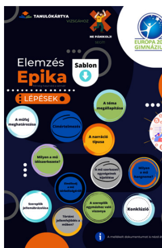
10. ábra: Részlet egy szakköri ppt-ből

A diákjaink az Európa 2000 Gimnáziumban abban a szerencsés helyzetben vannak, hogy mindig biztosítunk számukra javítási lehetőséget. Az Olvasónaplóm kapcsán „képesíthetik” azt az olvasmányt, amelyből kevésbé jól sikerült dolgozatot produkáltak. A canvasítás után, a saját tanáraik és osztályuk előtt számot adhatnak a tudásukról, ergo szóban elemezhetnek, a plakáton saját kezűleg elhelyezett szimbólumok segítségével. Természetesen az aszszociativitást tanítani és fejleszteni kell. Foglalkozni kell a képzettársítás művészi értelemben használatos mikéntjével. Azzal, hogy a hasonlóság, esetleg az ellentétesség hogyan tud formát ölteni s, konstans mementóként villódni az emlékezés tengelyén.