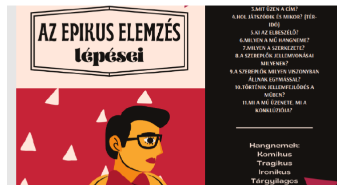
4. ábra: Részlet az Olvasónaplóm munkafüzetből

Az újítás következtében, lemondtam a diákok által készített nagyon egyedi, olykor koncepciótlan naplócskákról. Helyette - már a tavalyi (2021/2022) tanévre - elkészítettem egy kézzel fogható és tölthető, kilenc hónapot felölelő naptárral egybekötött 'füzetnaplót', amelyben kreatív tanulókártyákat helyeztem el, segítve ezzel is a diákok