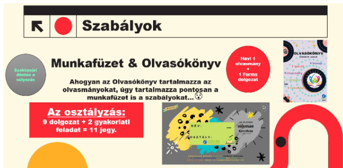
6. ábra: Az Olvasónaplóm-mozgalom szabályai

Az érettségi idejére pedig kiválóan megtanulnak majd műveket elemezni. Sajnos egy ponton tévedtem, ugyanis nem számoltam azzal, hogy a diákok nem szépirodalmi műveket választanak majd olvasandónak. A kitöltött naplók szemeztetése közben tudatosult bennem, hogy játszva tanulni is csak a megfelelő szabályok lefektetése után lehet, vagyis akkor, ha én jelölöm ki az olvasnivalót.