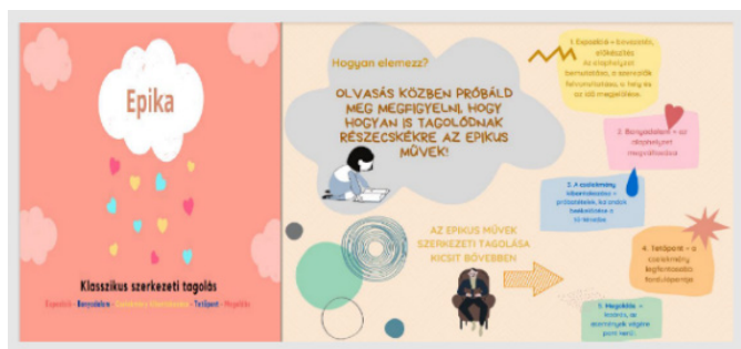
5. ábra: Részlet az Olvasónaplóm munkafüzetből

Az említett tanulókártyákat, a Canva.com szerkesztő-program segítségével szerkesztettem. Azt gondoltam, hogy a napló attraktivitása – mint pozitív befolyásolási tényező – erősítheti a diákokban a munkamorált. A kényszerű kötelezőség helyett, a játszva tanulás üdítő formáját is megismerhetik.