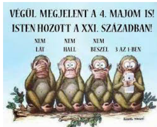
1. ábra: A váratlan segítség - kiinduló mém

Hódító hadjáratát csak később kezdte meg az olvasás. A diákoknak az olvasás iránti elköteleződéshez szüksége volt egy külső jelre. Egy olyan visszajelzésre önmagukról, amely ellenállásra ad okot, amely motivál, s amely bizonyításra készlet.