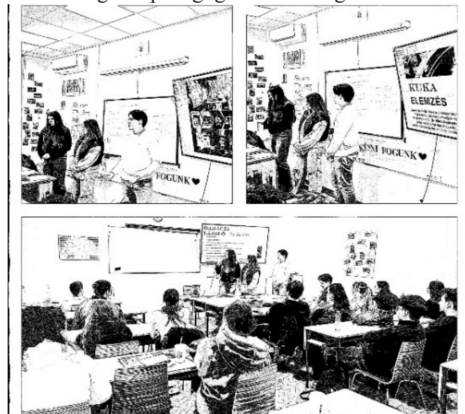
12. ábra: A 8.osztályosok bemutatója a végzősöknek

A már említettek - a nyer-nyerben való gondolkodás, az egymás kölcsönös támogatása, a 'képiség' hasznossága a pedagógiában – megvalósulásának