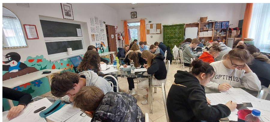
A képek Nyíregyházán a tanulmányi versenyek országos döntőjén készültek 2022/23. tanév végén.