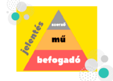
11. ábra: Az epikus elemzés

„Az elbeszélő művészet valódi súlya tehát nem azon van, amit mondunk és ami alapján vége igen véges, hanem azon, hogy hogyan mondjuk, ami viszont végtelen...” (Szint: Gyula: A mese alkonya c. tanulmányban olvasható)