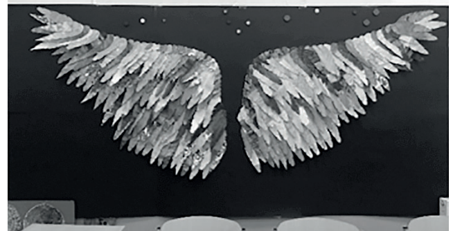
4. ábra: diákmunka 10. évfolyam

sak, akikről úgy gondolták, megérdemlik az elismerést. Az angyalszárnyhoz minden diák saját hangulatának megfelelő alapot festett, majd a tollakat külön vagdosztuk ki és felragasztottuk az előre megrajzolt felületre. Az alkotás épülése közben, ahogy bontakozott ki a forma és a színek kavalkádja, mindenki fontosnak tartotta, hogy részese legyen a folyamatnak. Az iskola területén több plakátot is elhelyeztünk, hogy minél több diákot mozgósítsunk. Az angyalszárnyról egy méretarányos molinó is készült, amit elvittünk a végzősök szalagavatójára, mert úgy gondoltuk, így nagyobb tömeget is megmozgathat az elismerés-/hálaprojektünk.