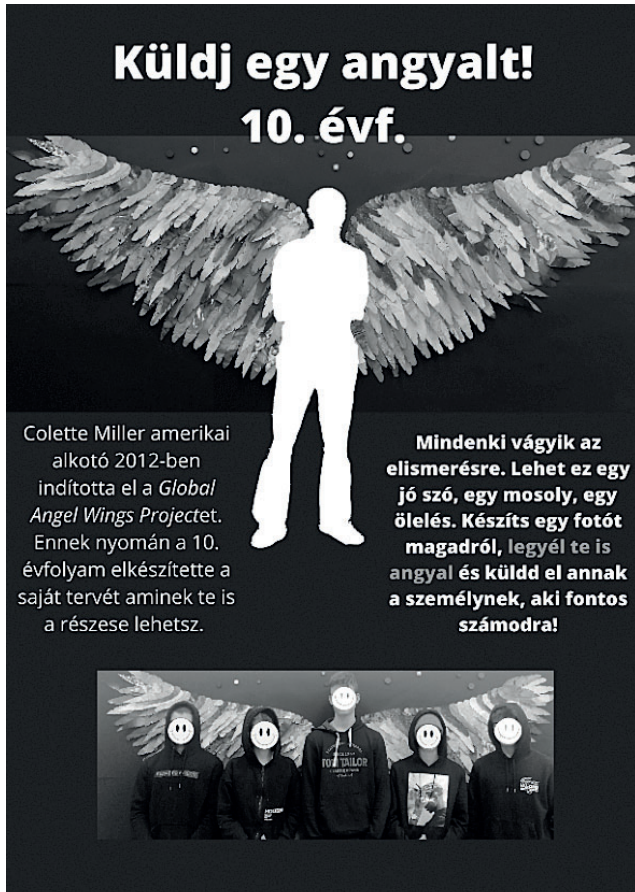
3. ábra: plakát „Küldj egy angyalt!”

Az NKP angyalok és ördögök témaköréhez kapcsolódva, Colette Miller Globális Angyal-szárny projektje nyomán készítettük el a saját közös nagy alkotásunkat a 10. évfolyam diákjaival.