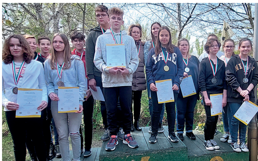
A dobogó legfelső fokán az Abonyi Somogyi Imre Általános Iskola „Anonymus” csapata. Második helyezett lett a Budapesti Gyulai István Általános Iskola „Sakk-matt” csapata. Bronzérmes az Abonyi Gyulai Gaál Általános Iskola „Génius Quartett” csapata