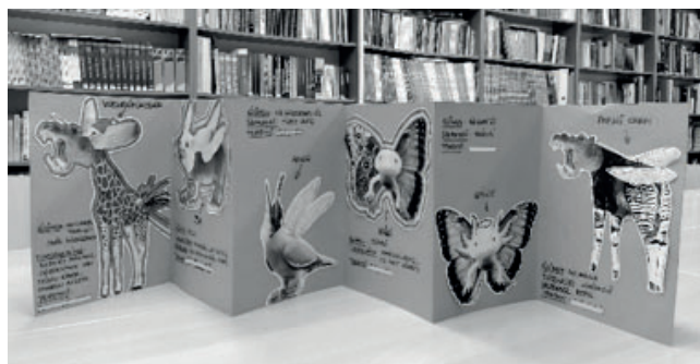
2. ábra: Mumuskönyv, diákmunka, 10. évfolyam

Következő két sikeres projektünk az Nemzeti Köznevelési Portál tankönyvéhez kapcsolódik. Az idejé izgalma fokozza a digitális tankönyv nyújtotta inspiráció, ami saját elképzeléseimet erősíti, miszerint egyes témák megközelítésénél a nagyívű kalandozás a művészetek területén figyelemfelkeltő és ösztönző, és rengeteg kapcsolódási lehetőséget ad a különböző tanulási területekhez. A mítosz-képzés egykor és ma