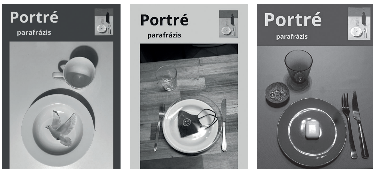
1., 3., 4. ábra: diákmunka, 10. évfolyam

rint kiről festhette a mester ezt a portrét, arról beszélgettünk, hogy önmaguk és mások megértéséhez nyitottság, többnézőpontúság szükséges, mint ahogy ez a festményen a tárgyak rálátásából is látszik. A feladat egy saját portré, fotó elkészítése volt a művész festménye nyomán, ahol önmagukat mutatták be, saját szimbólumrendszer kialakításával, figyelve az elrendezésre, a tárgyak elhelyezésére. A mondást, közlést rövid szöveggel is kiegészíthették. Következő órán az alkotásokat közösen néztük meg, és megpróbálták kitalálni, hogy melyik fotó kihez tartozik. Mindamellet, hogy sikert aratott a feladat, meglepően őszinte és szép alkotások születtek.