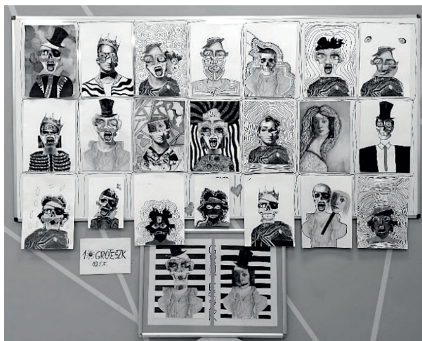
1. ábra: diákmunkák, 10. évfolyam

A projekt gyümölcsöző volt mind a négy tizedikes csoportomban, ezért egy egynapos időszaki kiállítás keretén belül bemutattuk az iskolatársaknak az elkészült műveket, hiszen intézményi szinten is fontosnak tartjuk, hogy egymás sikerét megismerjék.